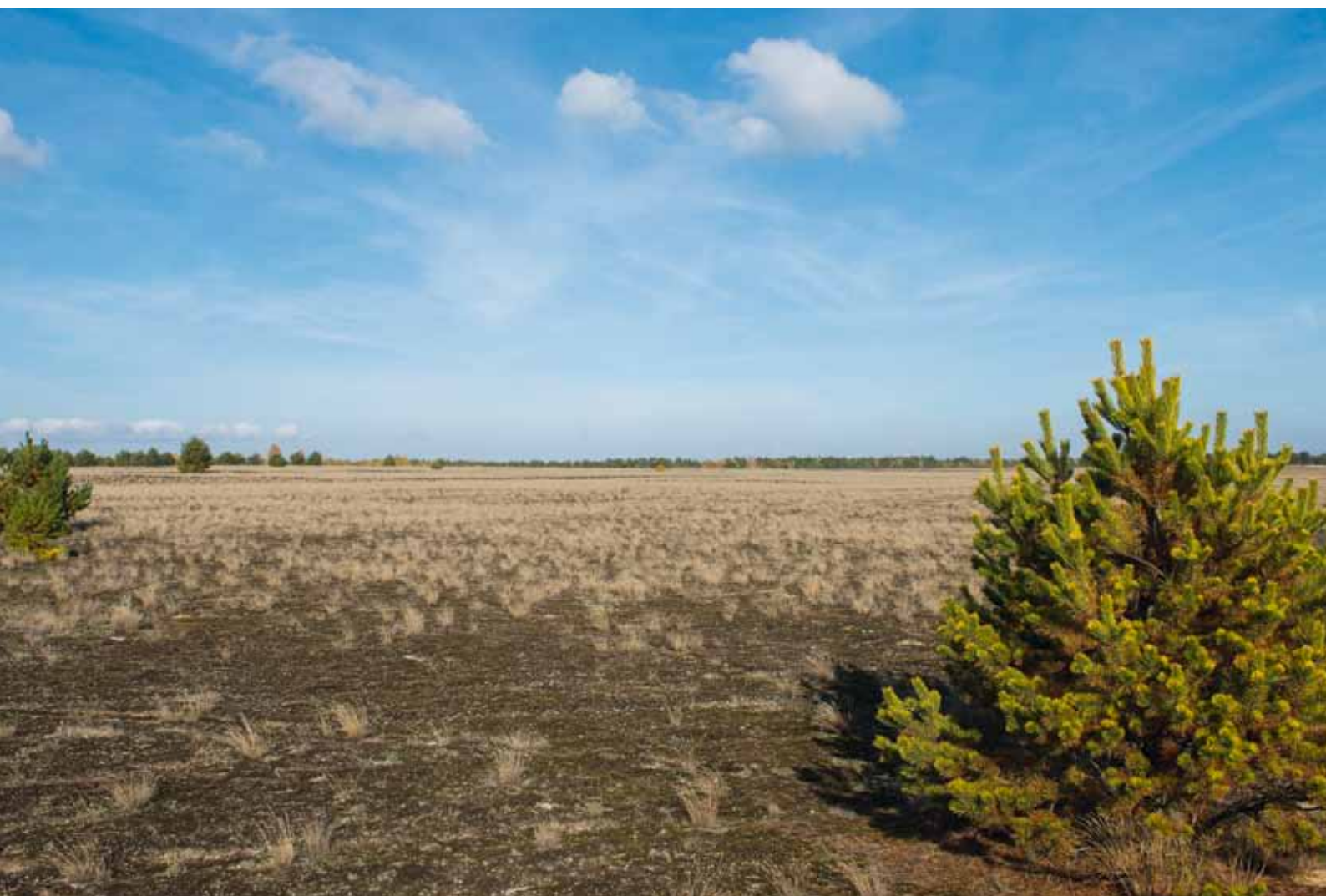
... in ehemals militärisch genutzten Gebieten ...