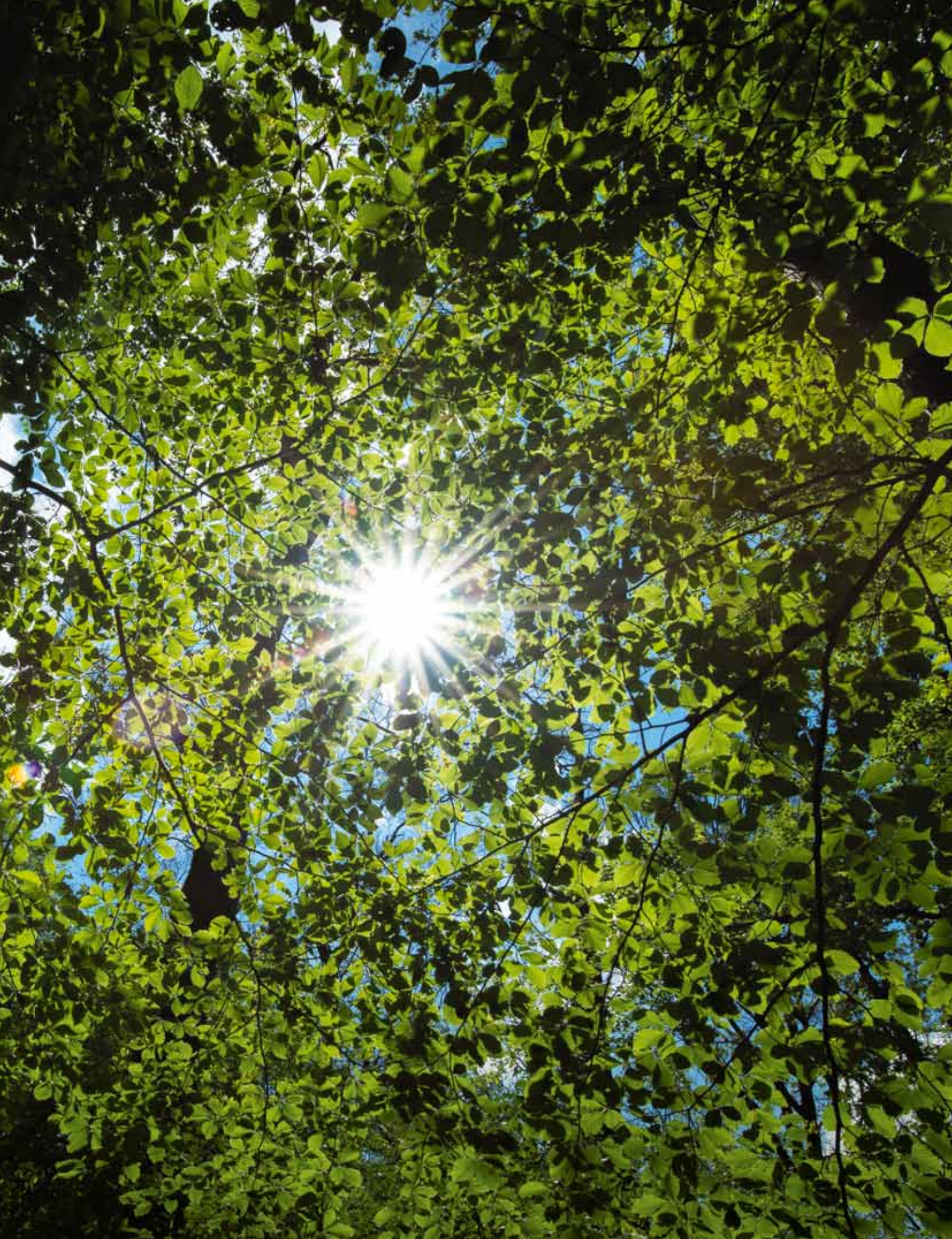
Innerhalb eines Biotopverbundes wirken große Wildnisgebiete als Kernbereiche. Kleinere nahe beieinanderliegende „Wildnisinseln“ sind wichtige Trittsteine für wenig mobile Arten.