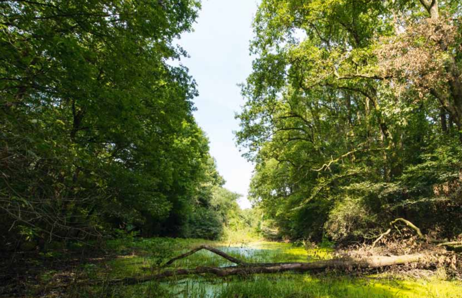
... in Flussauen und Seen ...