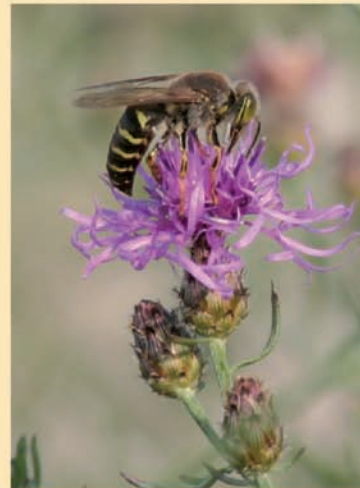
Flockenblume mit Kreiselwespe