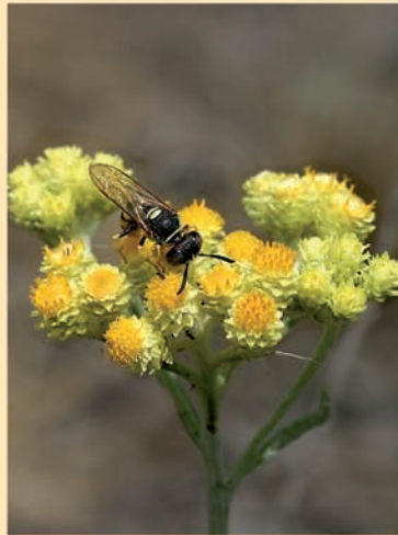
Sandstrohlume mit Bienenwolf