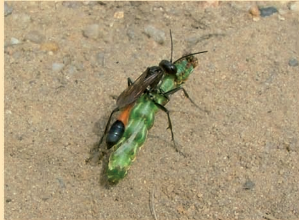
Sandwespe mit Beute

Bevor es zum nächsten Exkursionspunkt weiter geht, werfen wir noch einen Blick auf die Steilböschung im Hintergrund. An ihr kommt es immer wieder zu kleinen Rutschungen und Abbrüchen, wodurch die Vegetation auf natürlichem Weg beseitigt und Rohboden freigelegt wird. In solche Steilwände graben seltene Bienen- und Wespenarten sowie Uferschwalben ihre Bruthöhlen.