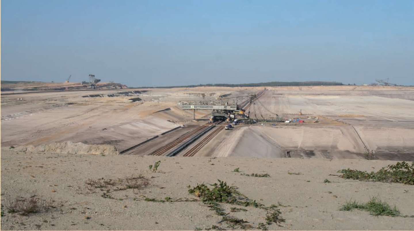
Noch heute ist die Lausitz durch den Braunkohlebergbau geprägt: Aktiver Tagebau Welzow-Süd im Jahr 2006

Nach dem zweiten Weltkrieg kamen die Braunkohlebagger in die Region und beseitigten diese von vielen Menschen geliebte Kulturlandschaft unwiederbringlich. Mit dem Tagebau verschwanden auch drei Viertel eines alten Naturschutzgebiets, das wegen seiner stattlichen Bäume und seines Auerwildvorkommens unter Schutz gestellt worden war. Das Sprichwort „Gott schuf die Lausitz und der Teufel vergrub die Kohle darunter“, könnte direkt in Grünhaus erfunden worden sein.